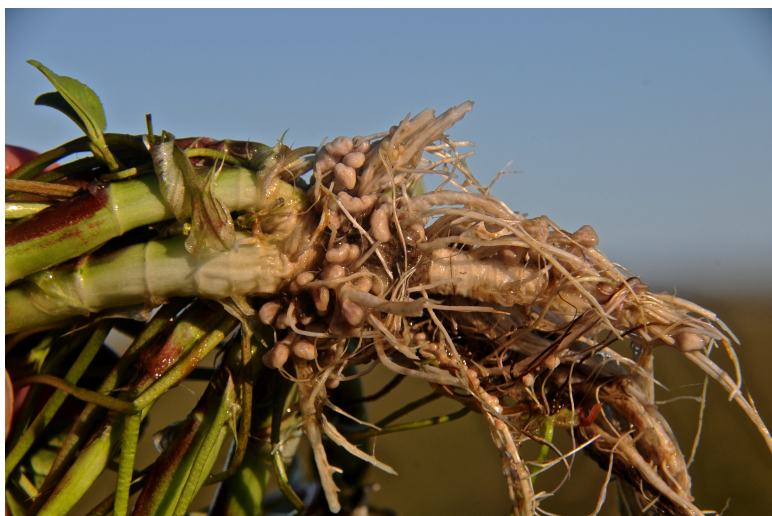
Figura 2. Produção de rhizobium capazes de fixarem nitrogênio