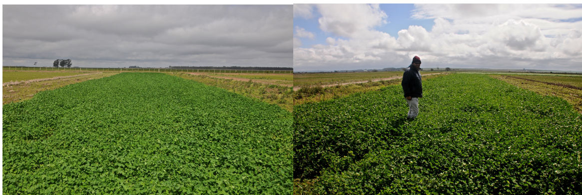
Figura 1. Vista da cultivada com trevo para implantação do experimento.

SOSBAI, Arroz Irrigado: Recomendações técnicas da pesquisa para o Sul do Brasil . SOSBAI: Cachoeirinha, 2018. 205 p.