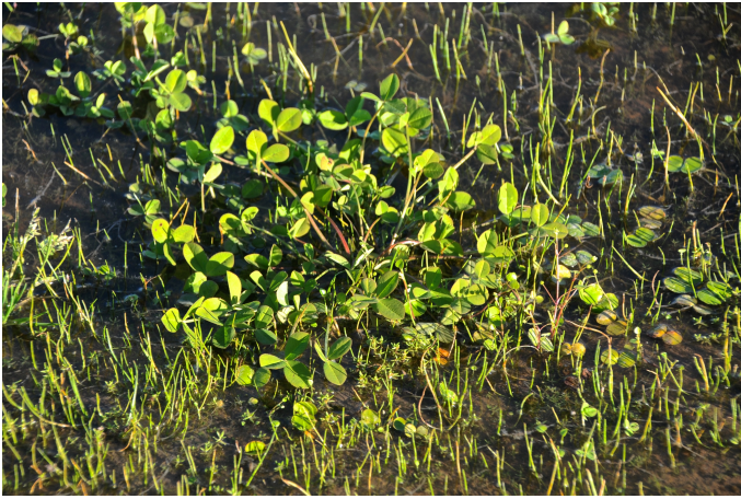
Figura 3. Uma de suas habilidades é tolerar o excesso hídrico nos solos de várzea do RS no período de inverno, são raras as plantas leguminosas com esta habilidade.